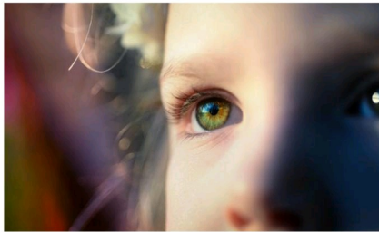
Selon la célèbre citation d'Oscar Wilde, « la beauté est dans les yeux de celui qui regarde »

Depuis la nuit des temps, l'homme peint, même sur la paroi d'une grotte rudimentaire. Donnez un instrument de musique à un enfant sous n'importe quel horizon, il cherchera à créer une jolie mélodie. Allongez-vous la nuit dans l'herbe sous un ciel dégagé, vous serez subjugué par la magnificence des étoiles et des nuages. Penchez-vous vers la fleur... Plongez au plus profond des mers, vous découvrirez des créatures que personne n'a jamais pu voir depuis des millénaires, et qui sont ciselées, parées délicatement de mille couleurs, jusque dans les moindres détails, juste comme si elles vous attendaient !